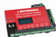
Sistema de Detecção de Fogo & Gás