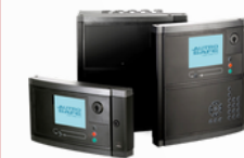
Sistema de Detecção e Alarme