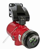
Detectores de Chama