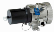
Detectores de Gases Hidrocarbonetos