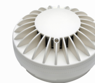
Detectores de Fumaça e Temperatura